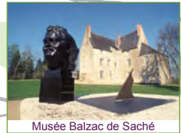
Musée Balzac de Saché